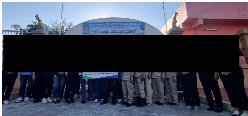
องค์การบริหารส่วนตำบลเขาหลวง