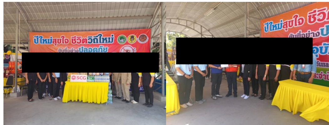
เทศบาลตำบลพุทรา