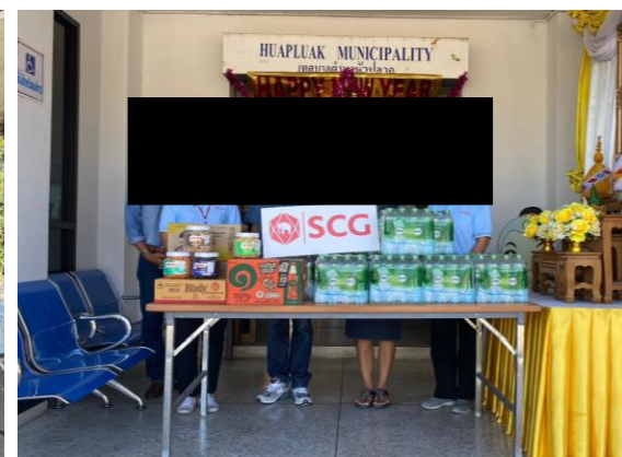
เทศบาลตำบลห้วยปลวก

เมื่อวันที่ 29 ธันวาคม 2566 ร่วมลงพื้นที่เยี่ยมเยียนจุดตั้งด้านบริการประชาชนช่วงเทศกาลปีใหม่ ในพื้นที่อำเภอพระพุทธรบาท อำเภอเสนาไห้